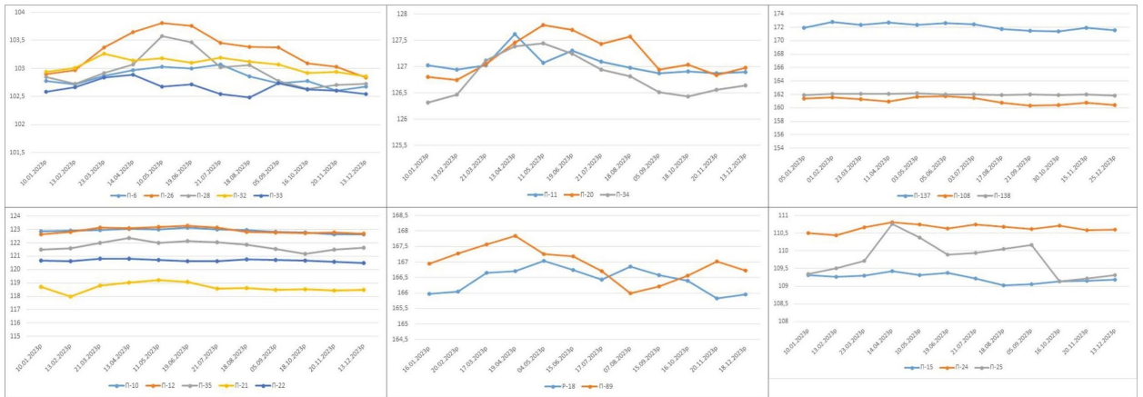
Рисунок 2. Спостереження за гідротехнічними спорудами Київської ГАЕС (2023 р.)